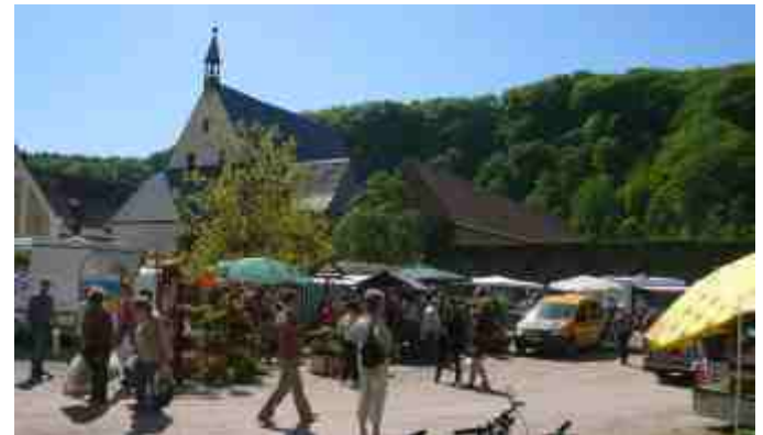
Bauernmarkt in Klosterbuch