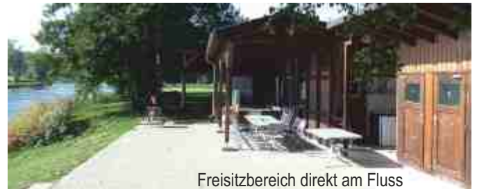
Freisitzbereich direkt am Fluss

Frühstück: wie bei Gruppenherbergen üblich als „Selbstversorger“ zu organisieren. Die Einrichtung verfügt über eine gut ausgestattete Kücheneinrichtung (große Kaffeemaschine, Backherd, Geschirr ...)