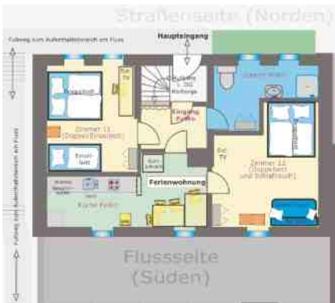
Zimmerplan der Gruppenherberge Bereich unten/oben