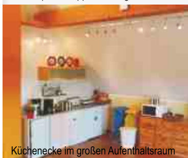
Küchenecke im großen Aufenthaltsraum

Der Aufenthaltsraum lässt sich auch als Schulungsraum nutzen. Technik wie Beamer, Flipchart kann man zubuchen.