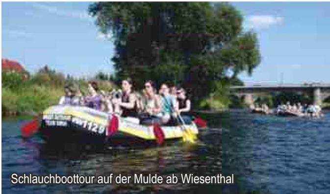
Schlauchboottour auf der Mulde ab Wiesenthal