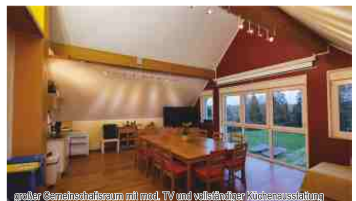
großer Gemeinschaftsraum mit mod. TV und vollständiger Küchenausstattung