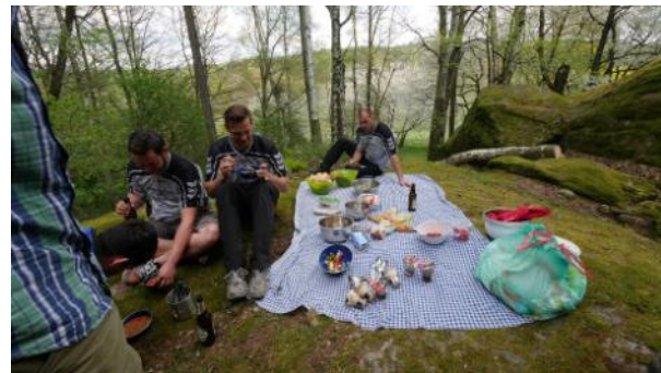
Mittagessen selbst bzw. gemeinsam zubereitet, auf einem großen Kocher kochen wir unser Gericht.