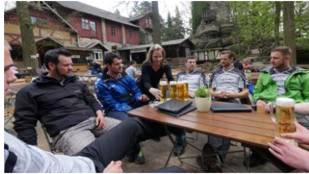
Aufstieg durch enge Felsschlüchte zum kleinen, urigen Berggasthaus, hier kann man bei einem frisch gezapften Bier erst einmal eine kleine Pause machen.