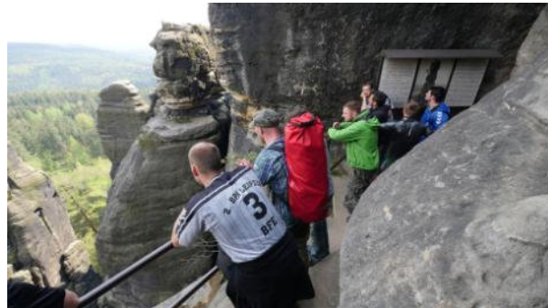
"Trekkingtour" durch die Felsenwelt des Pfaffensteins, immer wieder treffen wir auf atemberaubende Aussichtspunkte, am Ende der Tour sehen wir die legendäre Barbarine, eine imposante Felsnadel an der Südseite des Felsenmassives.