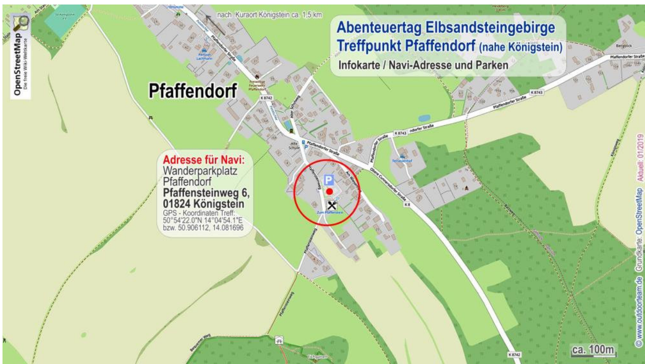
Bild oben: Karte vom Treffpunkt im Ort Pfaffenndorf auf dem Wanderparkplatz

Nur wenig Zeitlimit - und viel erleben? Sie suchen einen anspruchsvollen "Event" mit viel Action und Abwechslung - und wollen dazu noch eine der schönsten Regionen des Elbsandsteingebirges "hautnah" erleben? Trekkingtour, Höhlenerkundung, Geocaching und Bogenschießen - und unvergessliche Ausblicke auf die einmalige Felsenwelt hält dieses Angebot bereit.